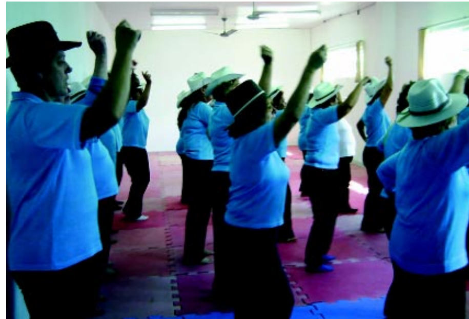
Idosas ativas do projeto Vão Livre participam de aula de dança na universidade, em Joinville

Chi Chuan. Ele é um exercício de intensidade moderada que, no paciente Idoso, tem proporcionado melhoras no equilíbrio e na estabi-